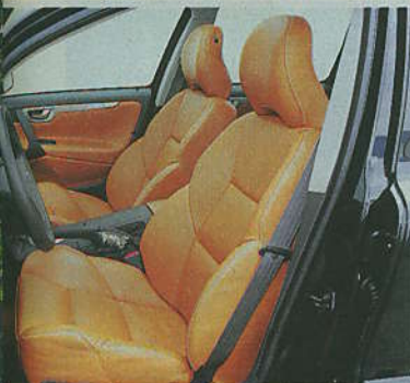
Luftige Ledersessel mit gutem Seitenhalt