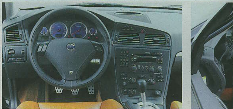
GEDIEGEN Das ergonomisch gelungene, schnörkellose Cockpit